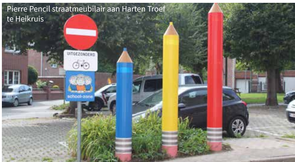
Pierre Pencil straatmeubilair aan Harten Troef te Heikruis