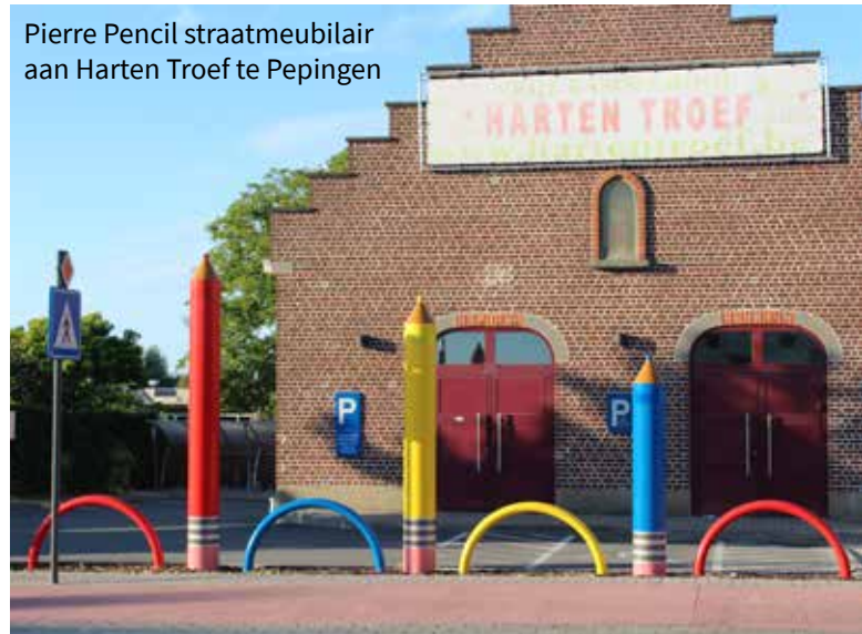
Pierre Pencil straatmeubilair aan Harten Troef te Pepingen

Ook daarom willen we op andere locaties bijkomende investeringen plannen.