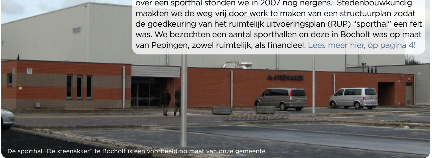
De sporthal "De steenakker" te Bocholt is een voorbeeld op maat van onze gemeente.

6 jaar lang werkte het CD&V-bestuur aan een dossier om in Pepingen een sporthal te kunnen bouwen. 6 jaar van hard werken samen met de sportdienst, de sportraad en de betrokken instanties want na 30 jaar palaveren over een sporthal stonden we in 2007 nog nergens. Stedenbouwkundig maakten we de weg vrij door werk te maken van een structuurplan zodat de goedkeuring van het ruimtelijk uitvoeringsplan (RUP) "sporthal" een feit was. We bezochten een aantal sporthallen en deze in Bocholt was op maat van Pepingen, zowel ruimtelijk, als financieel. Lees meer hier, op pagina 4!