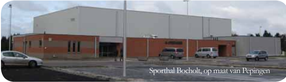
Sporthal Bocholt, op maat van Pepingen

De plannen voor de bouw van een sporthal op maat van onze gemeente waren klaar om midden 2013 te starten. En toen kwam VLD-NVA die zei dat het terrein te klein was. Begrijp wie kan. Het inplan-