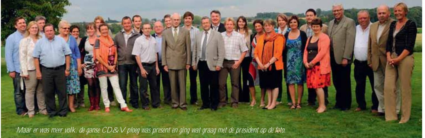
Maar er was meer volk: de ganse CD&V ploeg was present en ging wat graag met de president op de foto.

Het was niet de eerste keer dat Herman Van Rompuy te gast was bij CD&V Pepingen, maar nog nooit kregen we de president van Europa op bezoek. Het was dan ook een hoogdag toen op 9 juli president Van Rompuy ons een bezoek bracht en het fonkelnieuwe ontmoetingscentrum 't Schoolhuys opende.